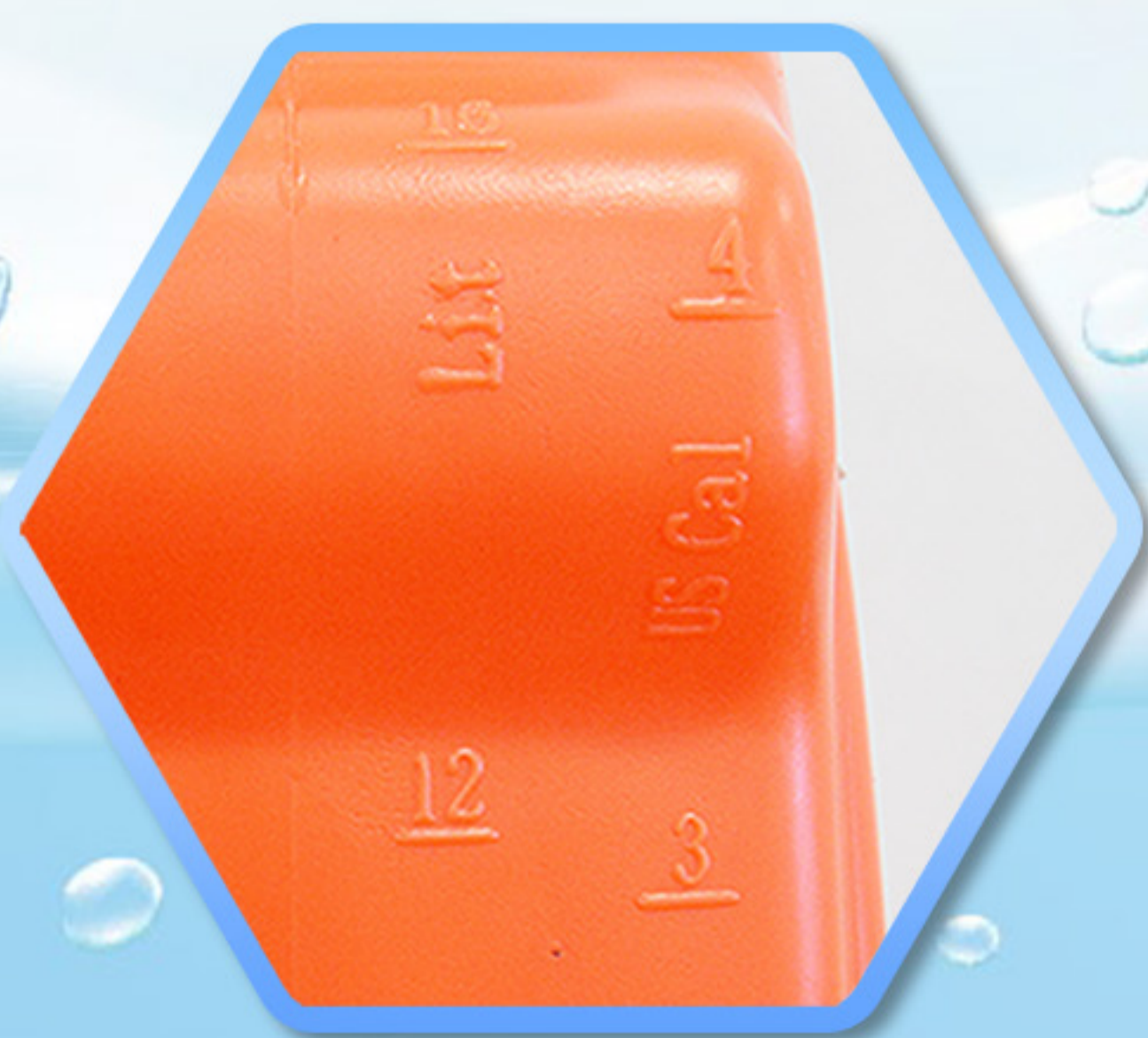
ตัวเลขบอกระดับน้ำกลั่น