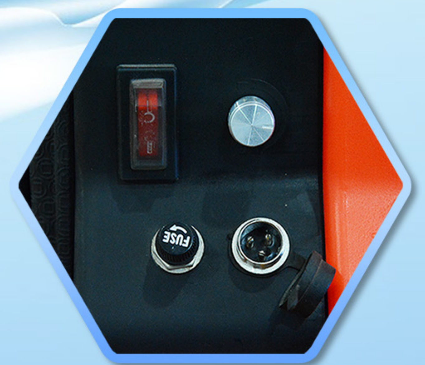
สวิตช์เปิด/ปิด ปุ่มปรับระดับความแรงน้ำกลั่น ช่องสำหรับชาร์จแบตเตอรี่