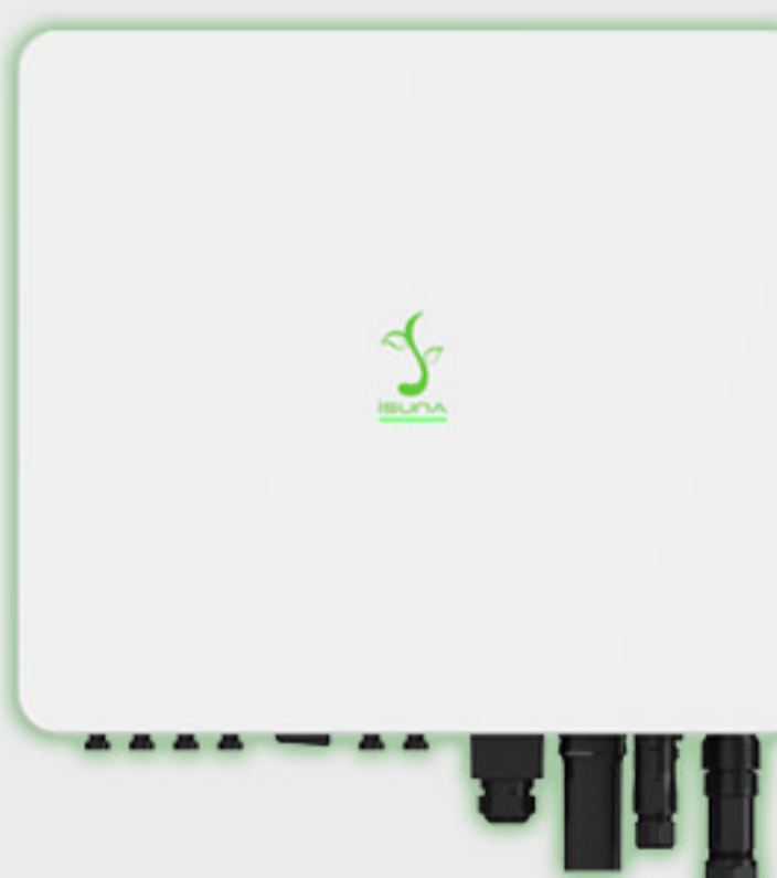
Three Phase HV 10-20 kW