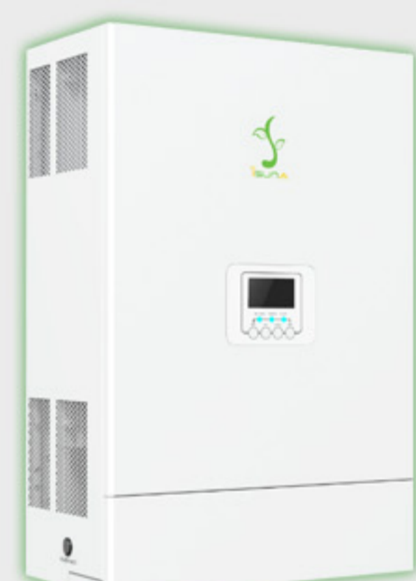
Single Phase LV 8-12 kW