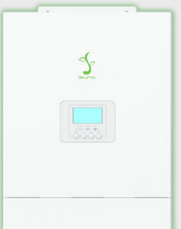
Single Phase LV 3-6 kW