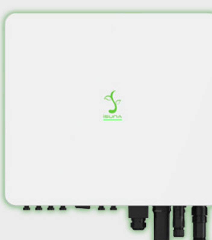
Three Phase HV 10-20 kW